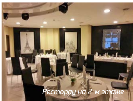
Ресторан на 2-м этаже