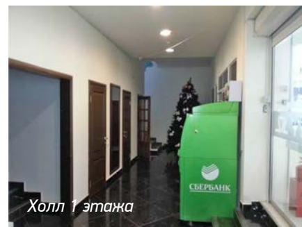
Холл 1 этажа