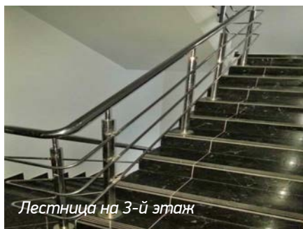
Лестница на 3-й этаж