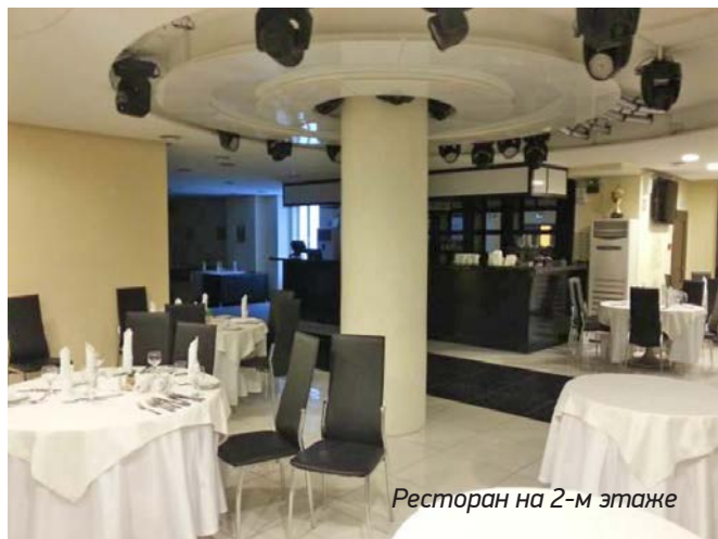
Ресторан на 2-м этаже