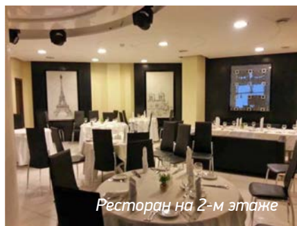
Ресторан на 2-м этаже