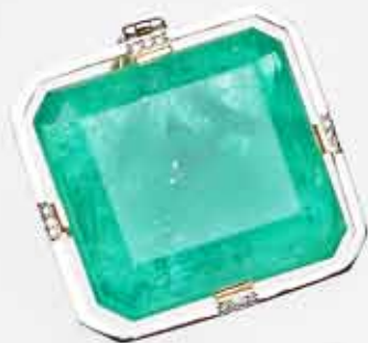
Подвеска из сплава золота 750 пробы, изумруд 36,06 ст Начальная цена: 747 277,20 руб.