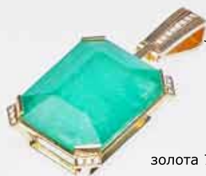
Подвеска из сплава золота 750 пробы, изумруд 21,87 ст Начальная цена: 456 386,50 руб.