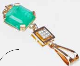
Подвеска из сплава золота 750 пробы, изумруд 9,67 ст Начальная цена: 160 310,41 руб.