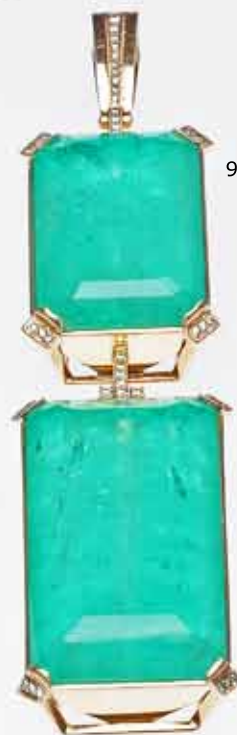
Подвеска из сплава золота 750 пробы, 2 изумруда 99,31 ст и 60,24 ст Начальная цена: 2 814 985,49 руб.