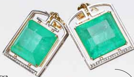
2 серьги из сплава золота 750 пробы, 2 изумруда 99,22 ст и 27,16 ст Начальная цена: 704 488,53 руб.