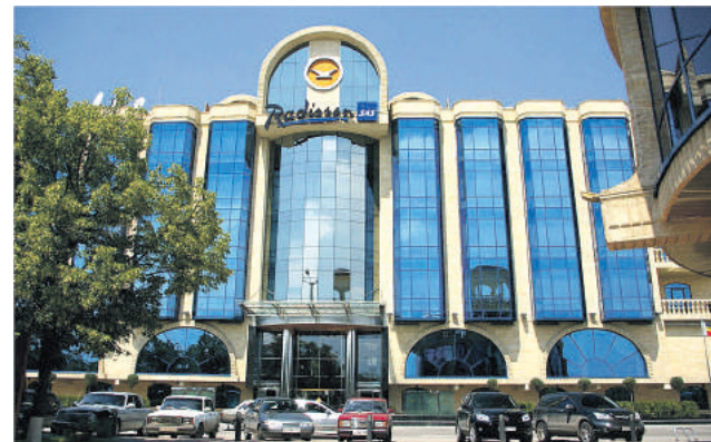
После шестилетней паузы отель на берегу Дона вновь откроется под брендом Radisson.

Гостиница «Танаис» в Ростове-на-Дону откроется до конца года, управлять ею будет Radisson. Четырехзвездочный отель на 81 номер с рестораном принадлежит «Группе Агроком». Она приобрела его в конце 2014 года на торгах Российского аукционного дома. Сейчас на объекте идут строительные работы.